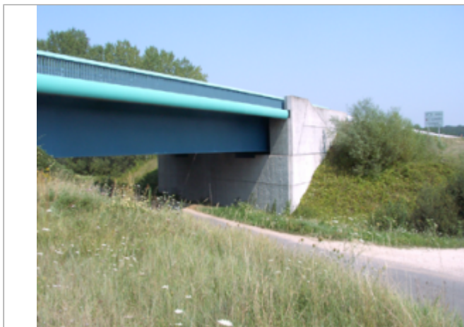
Vue du site BDHE 380 point de repère 553