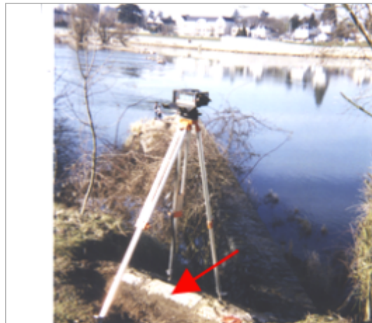
Vue du site BDHE 354 point de repère 505