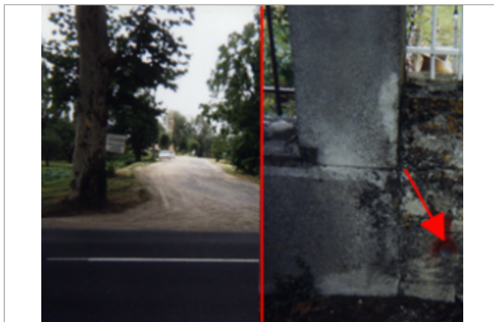
Vue du site BDHE 350 point de repère 491