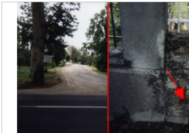
Vue du site BDHE 350 point de repère 491

Coordonnées WGS84 : X: 0.96443882 / Y: 47.40795510