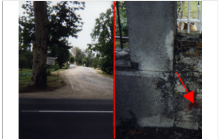
Vue du site BDHE 350 point de repère 491

Coordonnées WGS84 : X: 0.96443882 / Y: 47.40795510