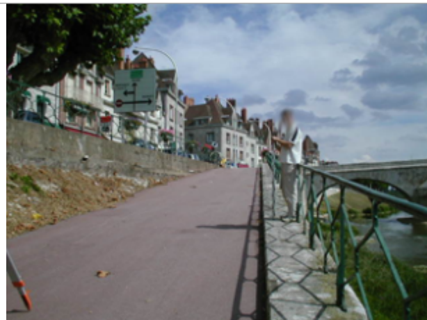
Vue du site BDHE 346 point de repère 610

Coordonnées WGS84 : X: 2.63087793 / Y: 47.68400770