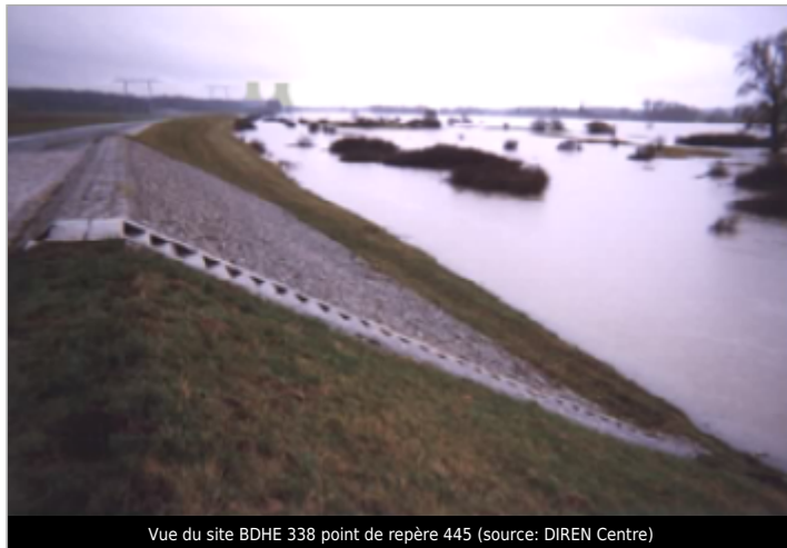
Vue du site BDHE 338 point de repère 445