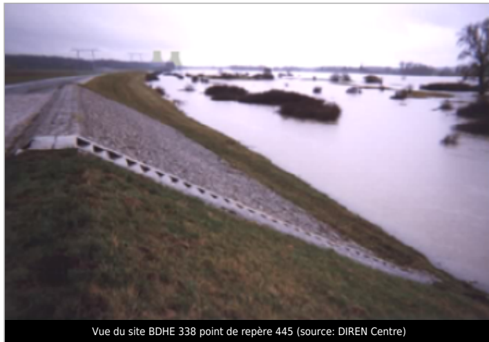
Vue du site BDHE 338 point de repère 445