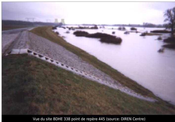
Vue du site BDHE 338 point de repère 445