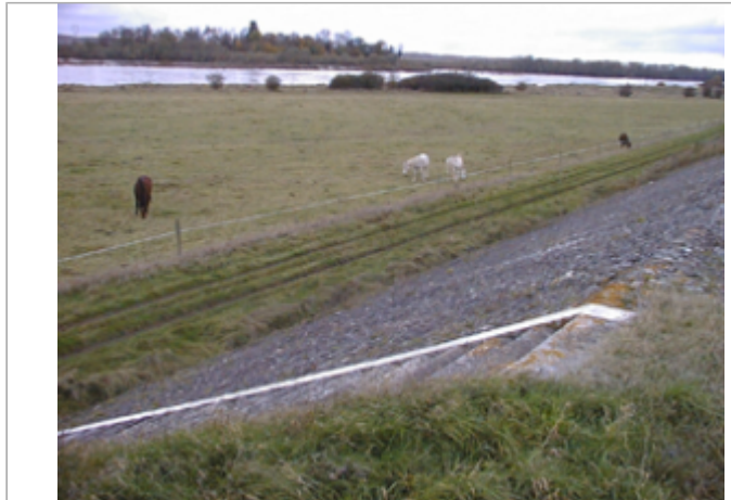
Vue du site BDHE 337 point de repère 444

Coordonnées WGS84 : X: 2.47095383 / Y: 47.75653390