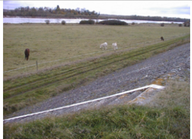
Vue du site BDHE 337 point de repère 444