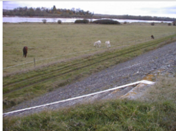
Vue du site BDHE 337 point de repère 444