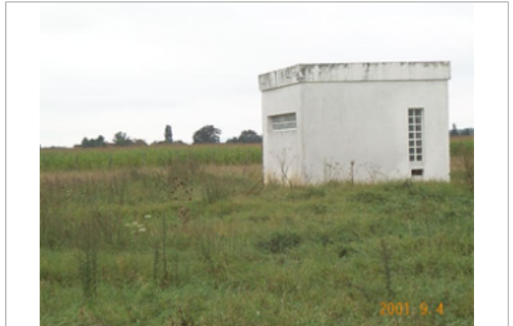
Vue du site BDHE 1196 point de repère 1549