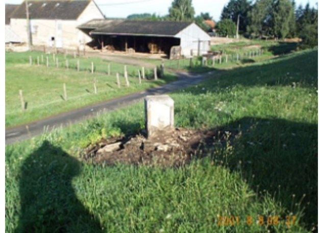
Vue du site BDHE 494 point de repère 1547