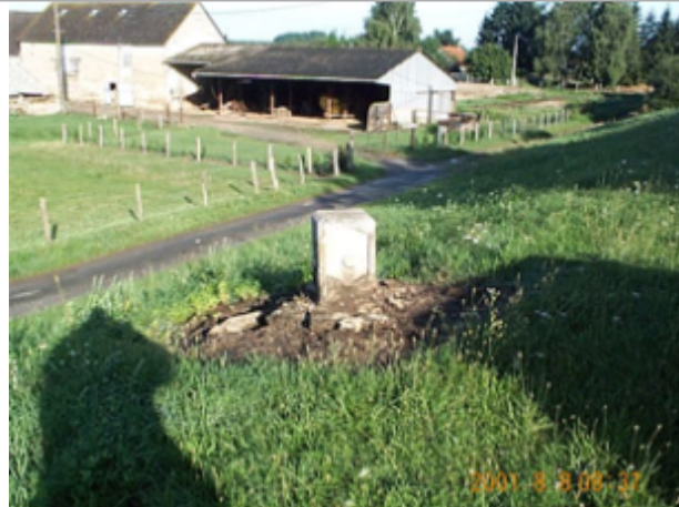
Vue du site BDHE 494 point de repère 1547

Coordonnées WGS84 : X: 3.06603612 / Y: 47.04147870