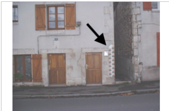
Vue du site BDHE 424 point de repère 644