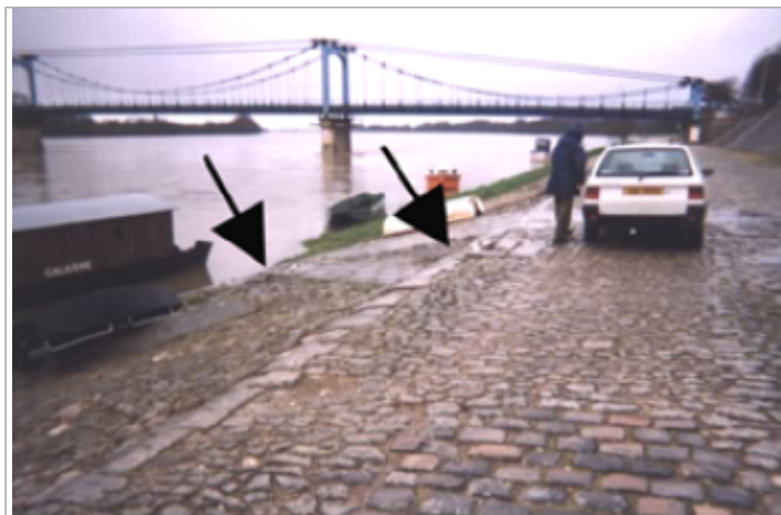
Vue du site BDHE 398 point de repère 138