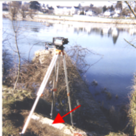
Vue du site BDHE 354 point de repère 505