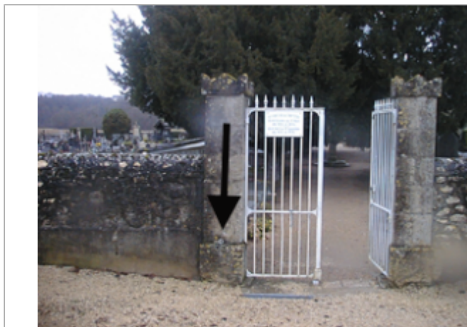
Vue du site BDHE 336 point de repère 443

Coordonnées WGS84 : X: 1.36518123 / Y: 47.60151520