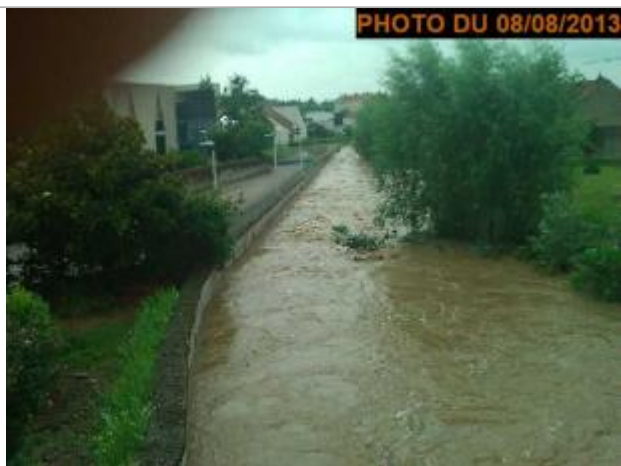
Vue de la photo en 2013

Altitude calculée de l'eau (en m) : 269.399