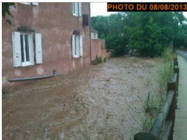
Vue de la photo en 2013

Altitude calculée de l'eau (en m) : 269.981