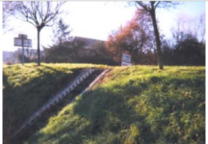
Vue du site BDHE 328 point de repère 435

Coordonnées WGS84 : X: 2.66083608 / Y: 47.66606060