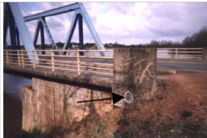
Vue du site BDHE 313 point de repère 409