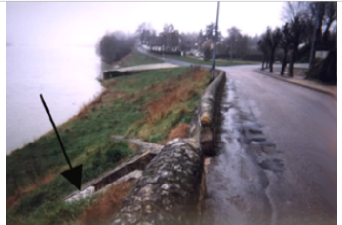
Vue du site BDHE 307 point de repère 590

Coordonnées WGS84 : X: 2.12325628 / Y: 47.87099640