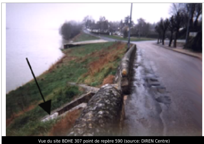
Vue du site BDHE 307 point de repère 590

GÉOLOCALISATION Coordonnées WGS84 : X: 2.12325628 / Y: 47.87099640 Coordonnées RGF93 (Lambert 93) X: 634455 / Y: 6752652.99 Coordonnées RGF93 (ETRS89) : X: 2.1232563 / Y: 47.8709964 Code Hydro: ----0000 Rive de référence: Droite