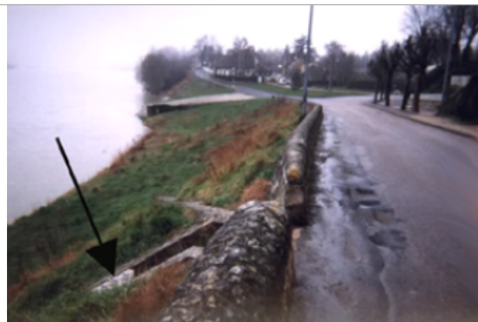
Vue du site BDHE 307 point de repère 590

Coordonnées WGS84 : X: 2.12325628 / Y: 47.87099640