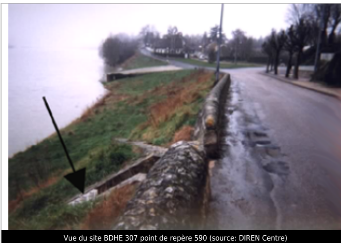
Vue du site BDHE 307 point de repère 590