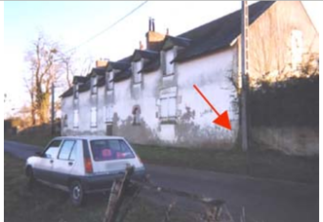
Vue du site BDHE 300 point de repère 393

Coordonnées WGS84 : X: 2.59655013 / Y: 47.69173400