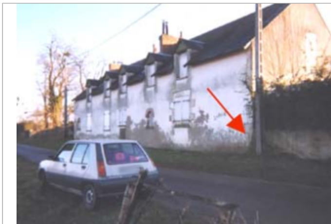
Vue du site BDHE 300 point de repère 393