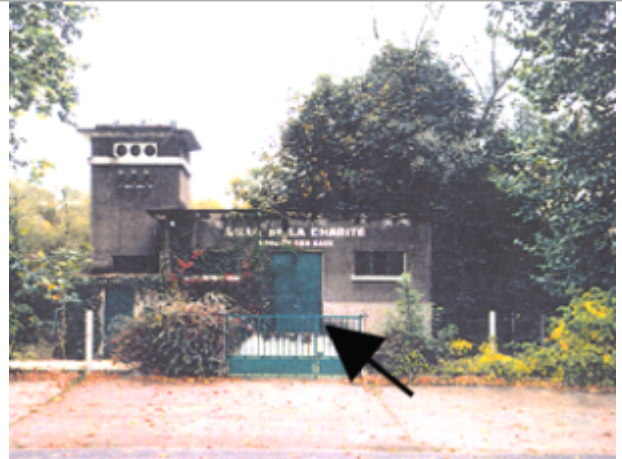
Vue du site BDHE 298 point de repère 388