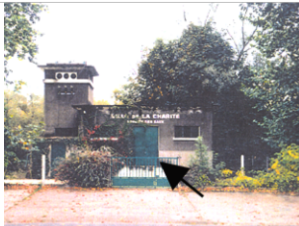
Vue du site BDHE 298 point de repère 388

Coordonnées WGS84 : X: 3.01593398 / Y: 47.16810670