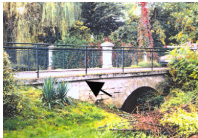
Vue du site BDHE 296 point de repère 386