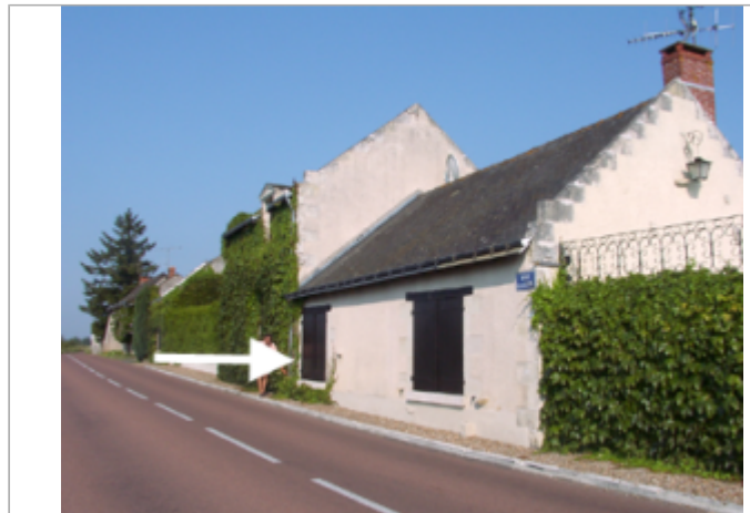
Vue du site BDHE 247 point de repère 313