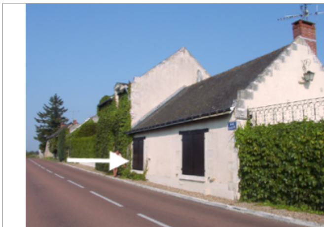
Vue du site BDHE 247 point de repère 313

Coordonnées WGS84 : X: 0.10959248 / Y: 47.22359440