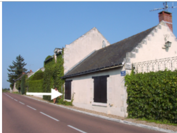
Vue du site BDHE 247 point de repère 313