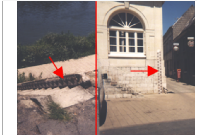
Vue du site BDHE 246 point de repère 312