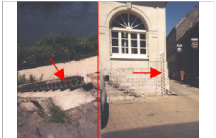
Vue du site BDHE 246 point de repère 312