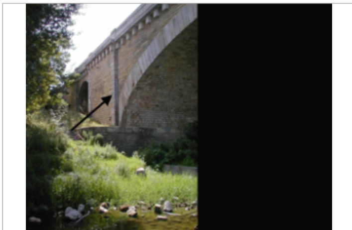
Vue du site BDHE 244 point de repère 309

Coordonnées WGS84 : X: 0.16104044 / Y: 47.23471280