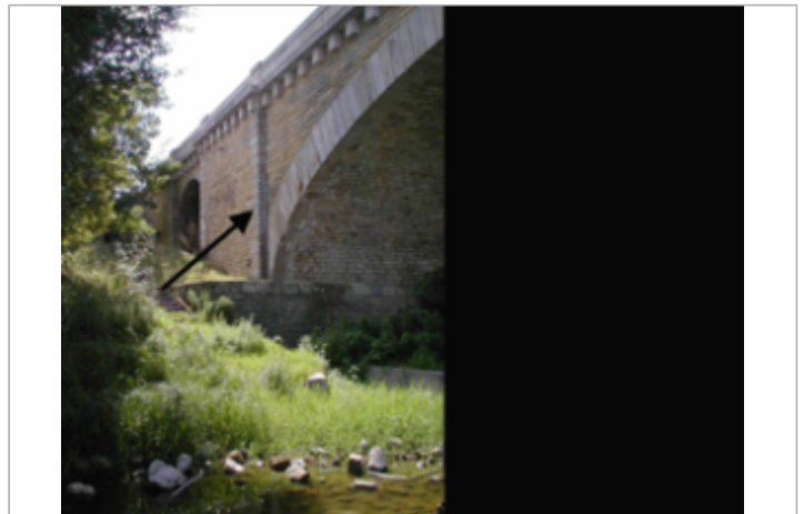
Vue du site BDHE 244 point de repère 309