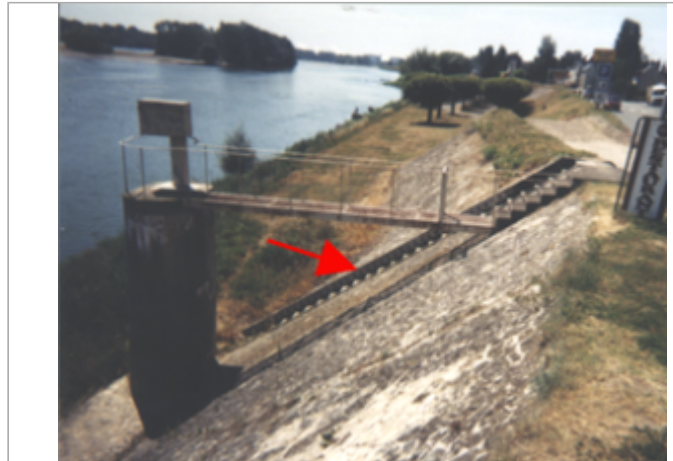
Vue du site BDHE 242 point de repère 305