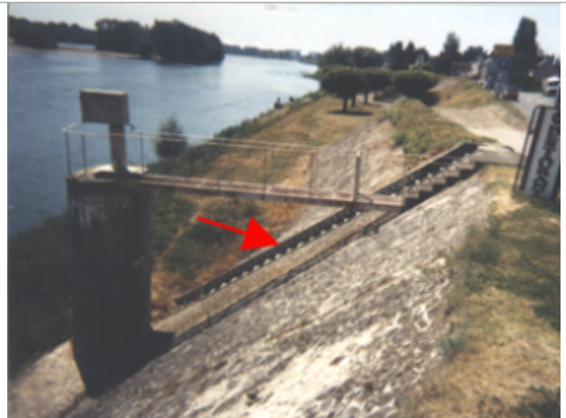
Vue du site BDHE 242 point de repère 305