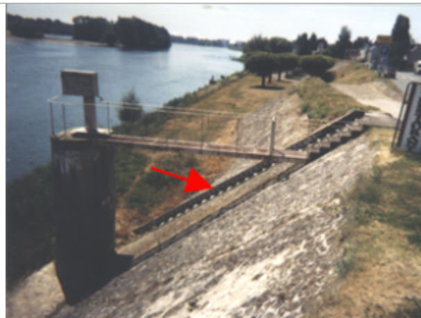
Vue du site BDHE 242 point de repère 305