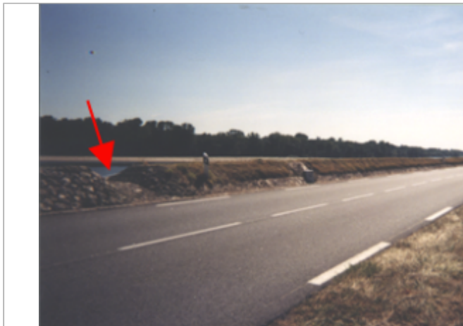
Vue du site BDHE 241 point de repère 304 (source: DIREN Centre)

Coordonnées WGS84 : X: 0.26705349 / Y: 47.26240260