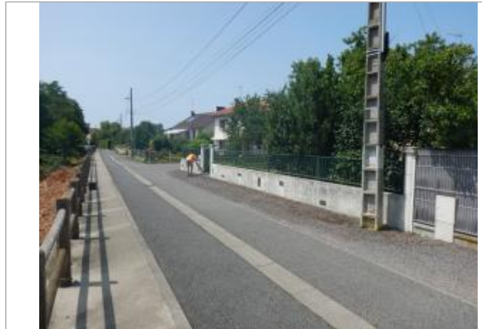
Vue du site en 2023

Coordonnées WGS84 : X: 3.45207698 / Y: 46.13665790