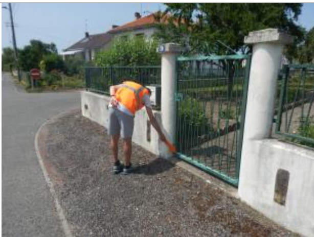
Vue du repère en 2023

Altitude calculée de l'eau (en m) : 268.826 m