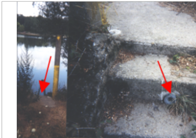
Vue du site BDHE 239 point de repère 302

Coordonnées WGS84 : X: 0.31986203 / Y: 47.27410230