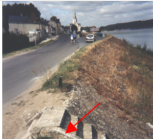
Vue du site BDHE 238 point de repère 301

Coordonnées WGS84 : X: 0.35976490 / Y: 47.29726600