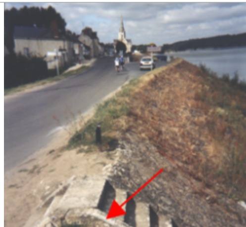
Vue du site BDHE 238 point de repère 301

Coordonnées WGS84 : X: 0.35976490 / Y: 47.29726600