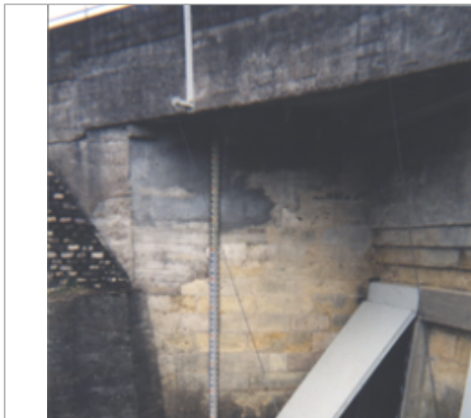
Vue du site BDHE 230 point de repère 290