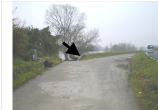
Vue du site BDHE 229 point de repère 586