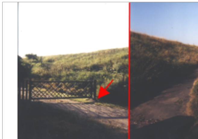
Vue du site BDHE 228 point de repère 288

Coordonnées WGS84 : X: 0.56162315 / Y: 47.37301530