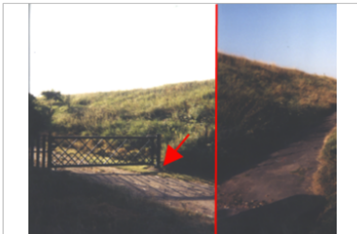
Vue du site BDHE 228 point de repère 288