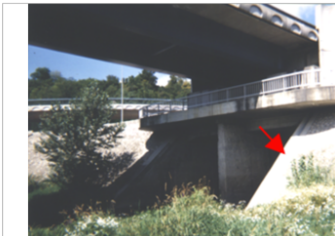
Vue du site BDHE 224 point de repère 285

Coordonnées WGS84 : X: 0.64701901 / Y: 47.39321130