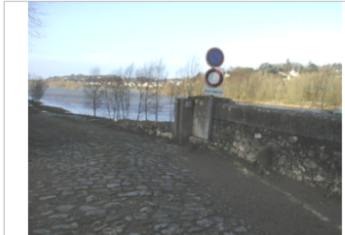
Vue du site BDHE 223 point de repère 284

Coordonnées WGS84 : X: 0.66869814 / Y: 47.39485490