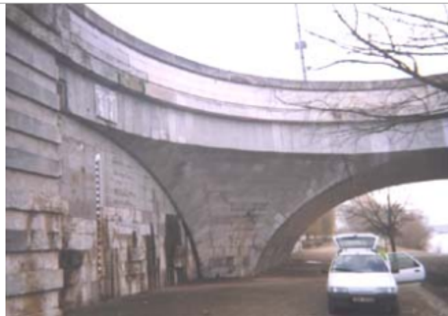
Vue du site BDHE 221 point de repère 282